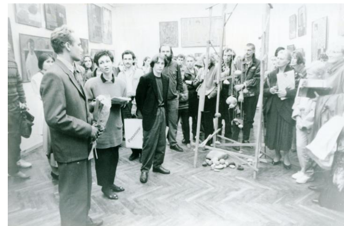
Вернисаж выставки «Каменный дождь» «Арт-пространство М. Шагала, г. Витебск»

Вот сейчас он держит револьвер у виска и не подозревает, какой смертельной опасности я его подвергаю. Ведь нажми я на курок, и этот простодушный, не задумываясь, застрелит себя. Сейчас я проучу его. Да, это грандиозно. Полный триумф человека, мыслящего над тупым животным. Сила моего разума сотворит небывалое. Мой враг застрелит себя сам.