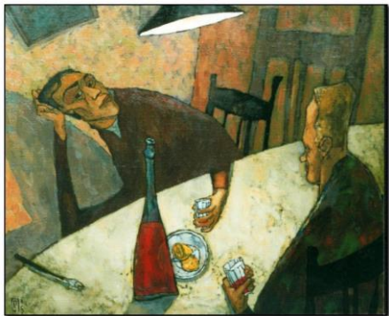
Пьяницы, 1995, /серия: пьяницы/

По вопросам организации экспозиции обращаться: Прусов С. Г. +375-29-713-78-12 Prusovstas@mail.ru