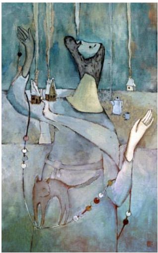
Продавец зимних туманов, 1992.